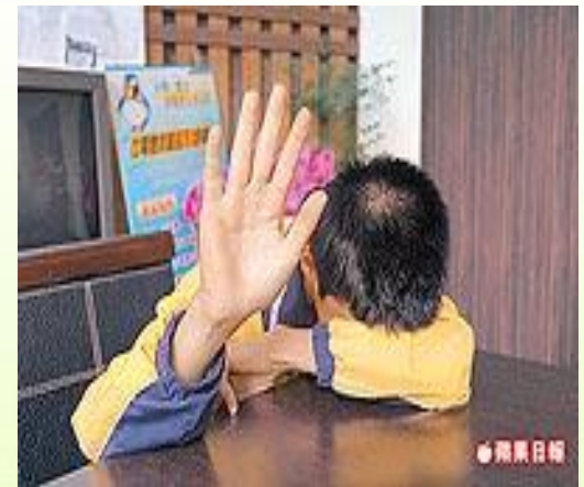
被毆同學表示共有五位同學毆打他

一名國中生，兩年來遭同學恐嚇要錢，只好假裝食量變大向家長多要零用錢支應；某周因未帶足夠的錢到校，遭同學拳腳相向，家長要他到訓導處求助，不料他一出訓導處即遭霸凌者嗆聲：「竟敢告狀！」讓他不敢上學。家長忍無可忍痛訴：「這是什麼世界？不給錢就得被揍？」